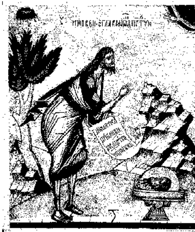
Jan Křtitel na poušti (Novgorod, neznámé období)

Liturgické shromáždění je sejití Božího lidu (bratří a sester) za účelem Boží oslavy. I když všichni mají činnou účast, neznamená to, že musí všichni dělat vše. Ve služebném shromáždění jsou určité služby, které mohou konat osoby